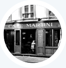
Marc S. Café Martini Paris

« J'apprécie spécialement la rapidité de Popina. En quelques taps, les commandes au bar en plein Happy-Hour sont prises, imprimées et encaissées. Je gagne aussi beaucoup de temps pour la fermeture de caisse et pour mon bilan comptable trimestriel. »